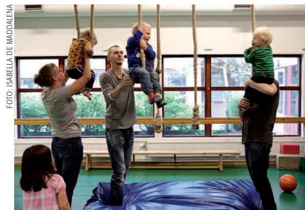
Lekrum i Stacken, Linköping

De som bor kollektivhus har sin egen lägenhet och ingår samtidigt i en gemenskap som utvecklas genom samarbete.