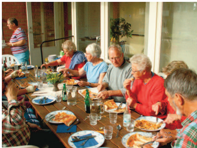
Tersen i Falun.

På Kollektivhus NU:s hemsida finner du alla adresser: www.kollektivhus.nu