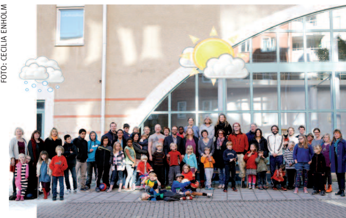
Kollektivhuset Södra Station i Stockholm.