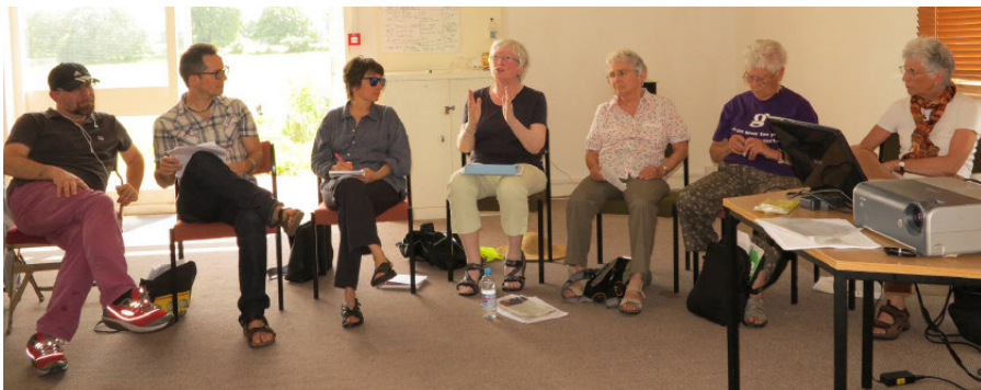
Från CoElderly-projektets möte i Laughton Lodge i Lewes. Till vänster de italienska deltagarna och till höger medlemmar i Old Women's Cohousing Group, som håller på att förverkliga ett kollektivhusprojekt i London.