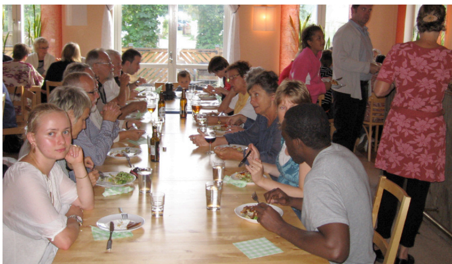
Matsalen i Vildsvinet.