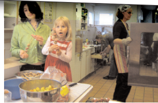
Barnmatlag i Södra Station, Stockholm. Vård: Svenska Bostäder