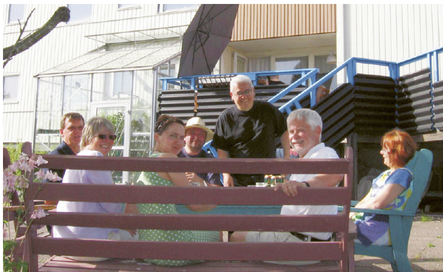
Tunnan i Borås hade över 100 besökare (bilden från ett tidigare tillfälle).