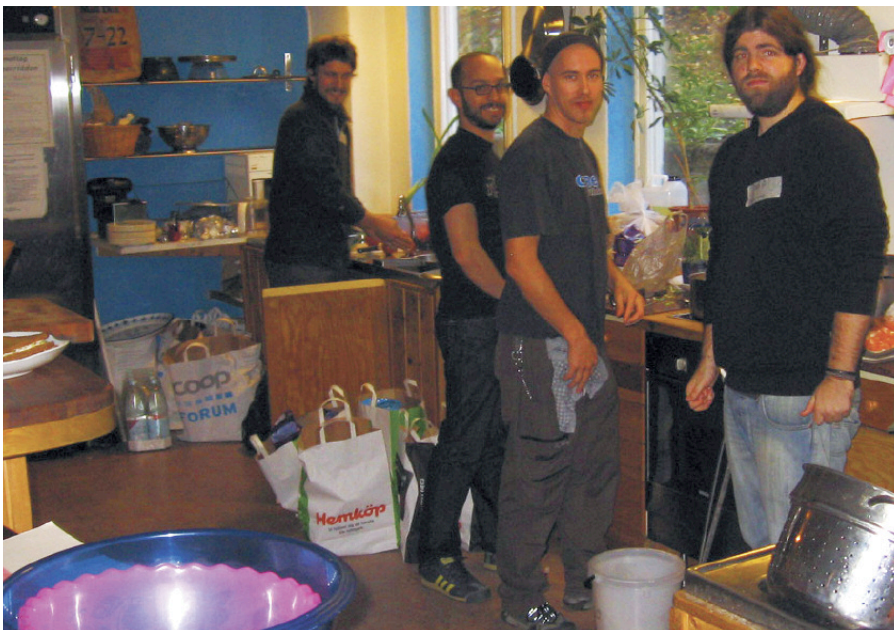
Köket i Stockholmsheims kollektivhus Cigarrlådan, Hökarängen.