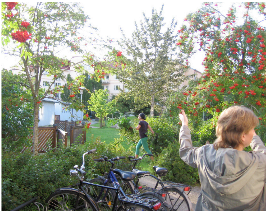
Den prunkande trädgården.

Vi hade rätt att ha 6-7 hönor. Det var inte vinterbonat i början. Vi gav bort eller leasade höns. Det var dvärghöns och sist Hedemorahöns. Det flesta tycker det är roligt med hönsen, särskilt barn. Ibland på sommaren har det väl klagats på att tuppen låter för mycket. Ett år hade vi ingen tupp,