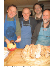
Kockar i Tullstugan i Stockholm.