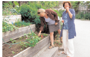
Ödlingar i Fullersta Backe, Huddinge. Vård: Huga Fastigheter AB